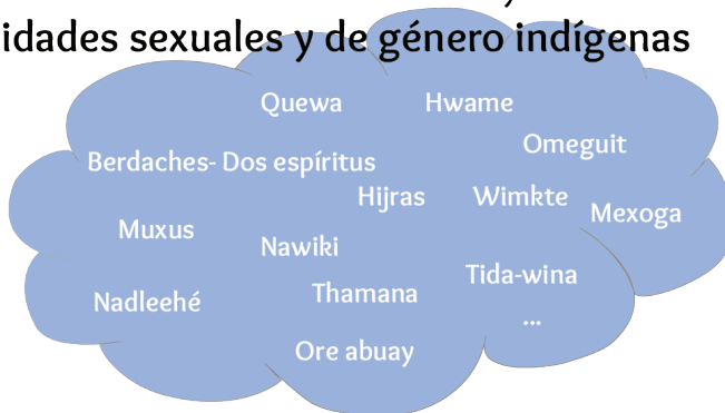
Gráfico 3: Nube Identidades sexuales y de género indígenas . Elaboración propia