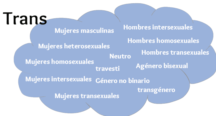
Gráfico 1. Nube Diversidad Trans* : Elaboración propia

Las regulaciones sociales y legales de la diversidad sexual y de género se realizan en un contexto que sigue un modelo dominante patriarcal, heteronormativo, neoliberal y etnocéntrico. Un modelo que funciona ilegalizando, patologizando y excluyendo aquellas sexualidades y géneros considerados fuera de la norma o de las cosmovisiones occidentalistas. (INAI/NABI, 2017).