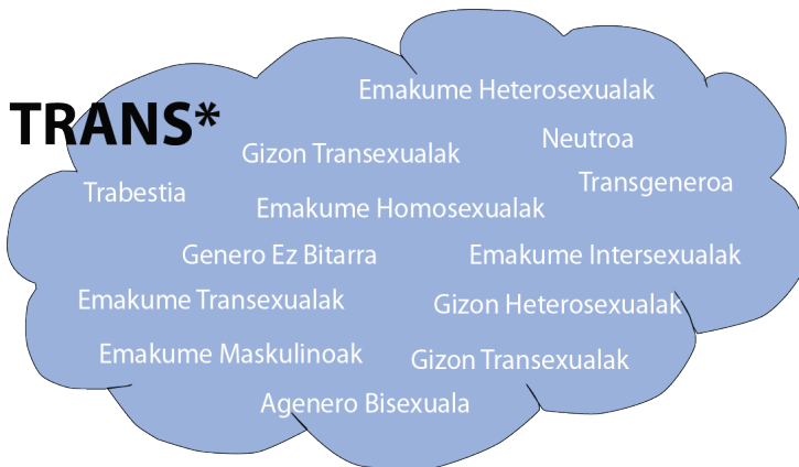
1. grafikoa. Trans* aniztasunaren hodeia.

Sexu- eta genero-aniztasunaren arautze sozialak eta legalak eredu nagusi patriarkal, heteronormatibo, neoliberal eta etnozentriko bati jarraitzen dion testuinguru batean gauzatzen dira. Eredu horrek ilegalizatuz, patologizatuz eta arautik edo mundu-ikuskerara mendebalderetik at dauden sexualitate eta genero horiek baztertuz funtzionatzen du.