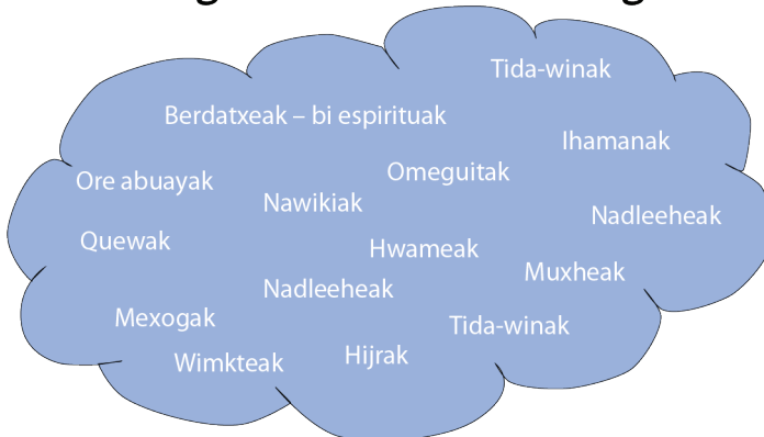
3. grafikoa. Sexu- eta genero-identitate indigenen hodeia.